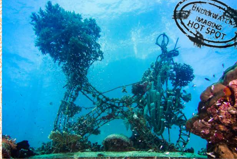
Pulau Pef – avec son propre récif stupéfiant et surprenant