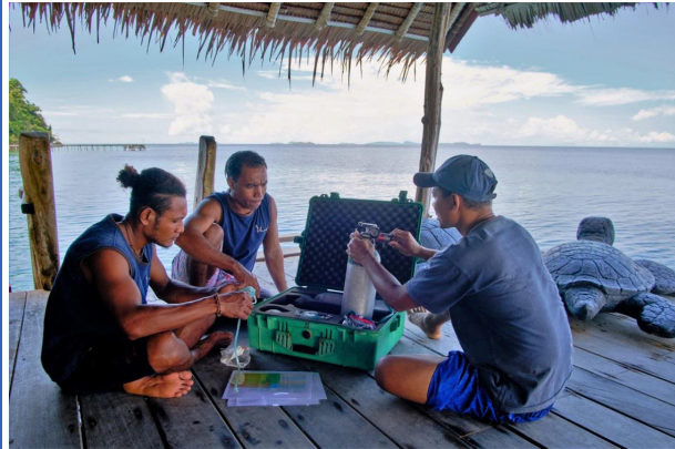
Les coffres de premiers soins avec l'oxygène, qui se trouvent sur les bateaux en cas d'urgence, sont testés.