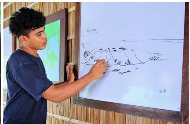
...et pratiquer les briefings en anglais.