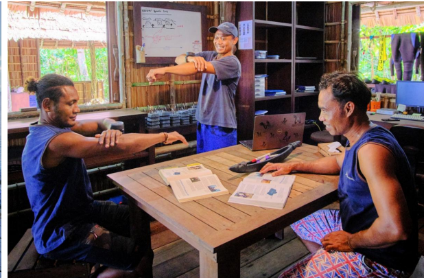
La navigation est étudiée et rafraîchie.