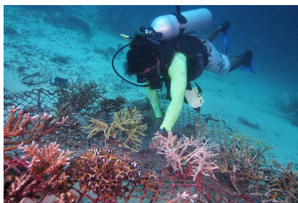
Les récifs créés artificiellement prospèrent.