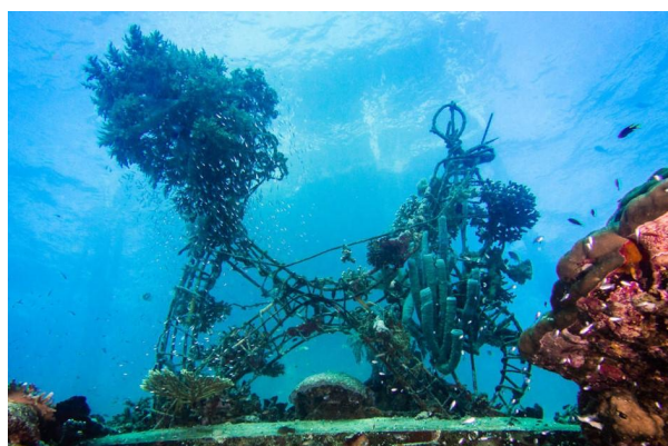
Notre logo à 12m de profondeur prend forme.