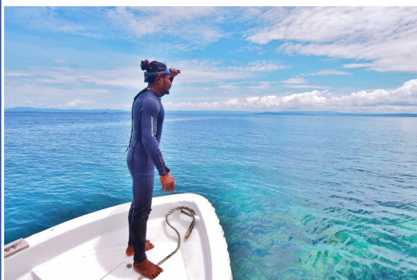
Trouver des sites de plongée...