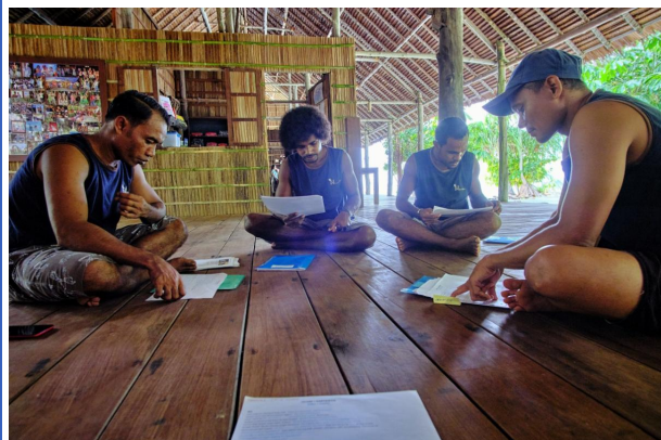
Des cours continus d'anglais...