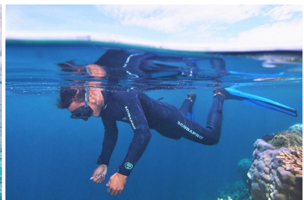
Vérifier le courant...