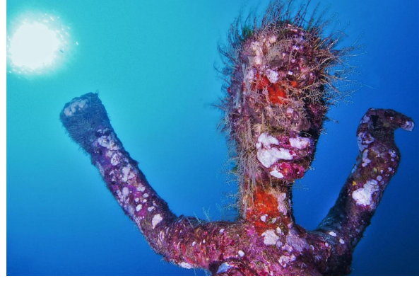
Les personnages dansants à 25m de profondeur ont pris de la couleur et changé de coiffures.